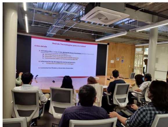
Asistentes en modo virtual / orden de día